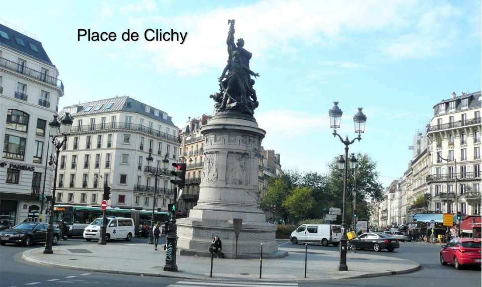
Place de Clichy

La fontaine Wallace se dresse à quelques mètres d'un énorme rond-point avec un monument central. Cette fontaine Wallace est probablement l'une des quarante premières, bien qu'elle ait été déplacée de son emplacement original.